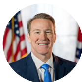
SENADOR DE LOS ESTADOS UNIDOS POR OHIO JOHN HUSTED (R) HUSTED.SENATE.GOV

Cámara de Representantes de los Estados Unidos house.gov