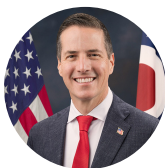
SENADOR DE LOS ESTADOS UNIDOS POR OHIO BERNIE MORENO (R) MORENO.SENATE.GOV